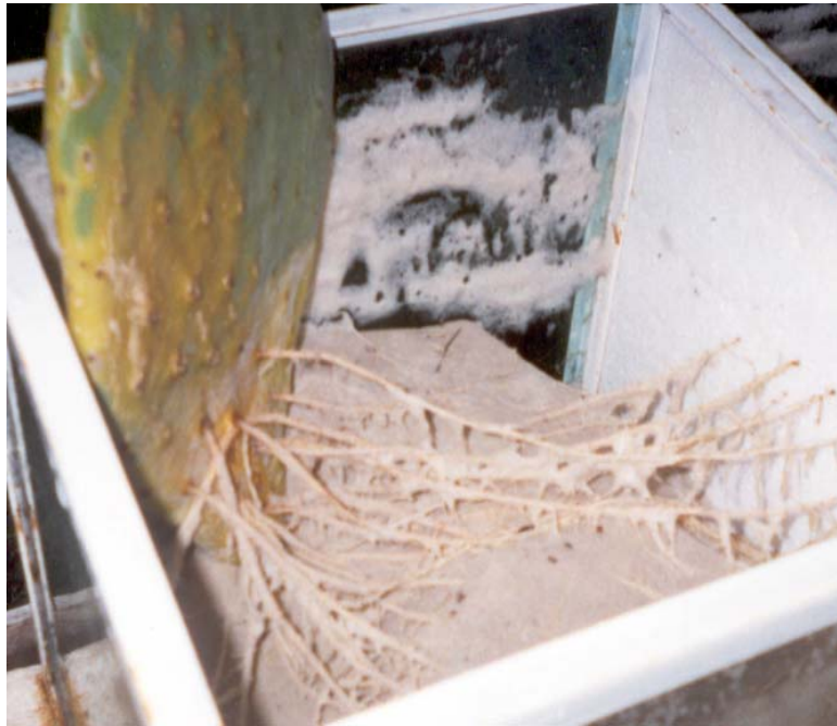
Figura 1. Desarrollo de raíces de nopal Opuntia ficus-indica utilizando un contenedor con tres paredes de vidrio y una de poliuretano.

De cada una de las variedades, se seleccionaron pencas uniformes y sanas, mismas que después de ser separadas de la penca madre, permanecieron bajo sombra durante tres semanas, con el fin de estimular la cicatrización del corte en la base. Posteriormente se plantaron en contenedores de vidrio de 40 x 40 x 40 cm, de largo, ancho y profundidad, respectivamente, los cuales se llenaron con arena sílica como medio de soporte y se regaron manualmente manteniendo la humedad cercana a capacidad de campo, con una solución nutritiva estándar que se ha utilizado y recomendado en trabajos anteriores con resultados favorables en condiciones de hidroponía (Calderón et al. , 1997; Zúñiga y Vázquez, 1998). Al sembrar las pencas, se colocaron lo más cercano posible (10 cm) a una de las paredes del contenedor de cristal, con el fin de registrar visualmente la aparición de la primera raíz de cada penca y cada variedad, respectivamente, de tal manera que se registraran las diferencias entre variedades y evitar registros por eventos aleatorios o fortuitos. Tres de las paredes de los contenedores eran de cristal y una de poliuretano, ésta última se colocó para separar cada una de las pencas de cada repetición y cada variedad, respectivamente (Figure 1), permitiendo además realizar con mayor facilidad las mediciones de las variables asociadas al crecimiento de las raíces.